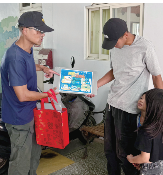
東莒消防分隊出動救護車巡迴各村廣播，並走進各家戶宣傳，提醒鄉親提前做好防颱整備。

【記者蔡夢玲報導】巴威颱風逐漸逼近馬祖，東莒消防分隊出動救護車沿島巡迴廣播，並走進各村落沿戶宣傳，提醒鄉親提前做好防颱準備，降低颱風可能帶來的災害風險。 颱風來臨前夕，東莒消防分隊（10）日總動員，消防人員利用救護車巡迴各村廣播，提醒鄉親提前做好防颱準備，降低颱風可能帶來的災害風險。 東莒消防分隊表示，隨著颱風逐漸接近，風雨將持續增強，希望透過巡迴廣播及沿戶宣傳，提升鄉親防災意識，提醒大家提早完成各項防颱整備，降低颱風可能帶來的災害風險。