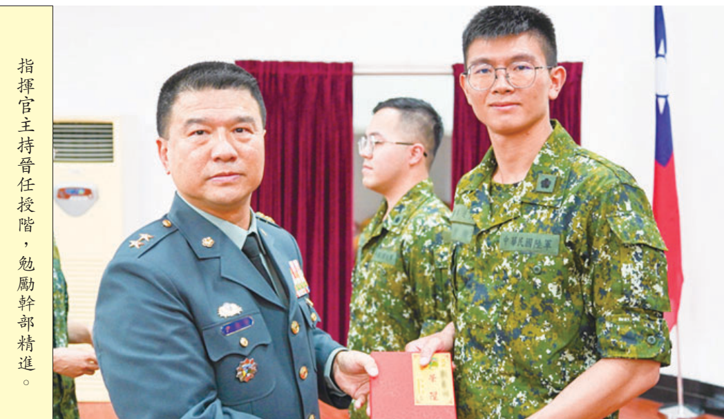
指揮官主持晉任授階，勉勵幹部精進。

挑戰的精神。他勉全體同仁持續按部就班、精益求精，將每項工作做到最好，持續提升部隊整體戰力。