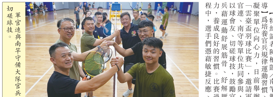
軍官連與南竿守備大隊官兵切磋球技。