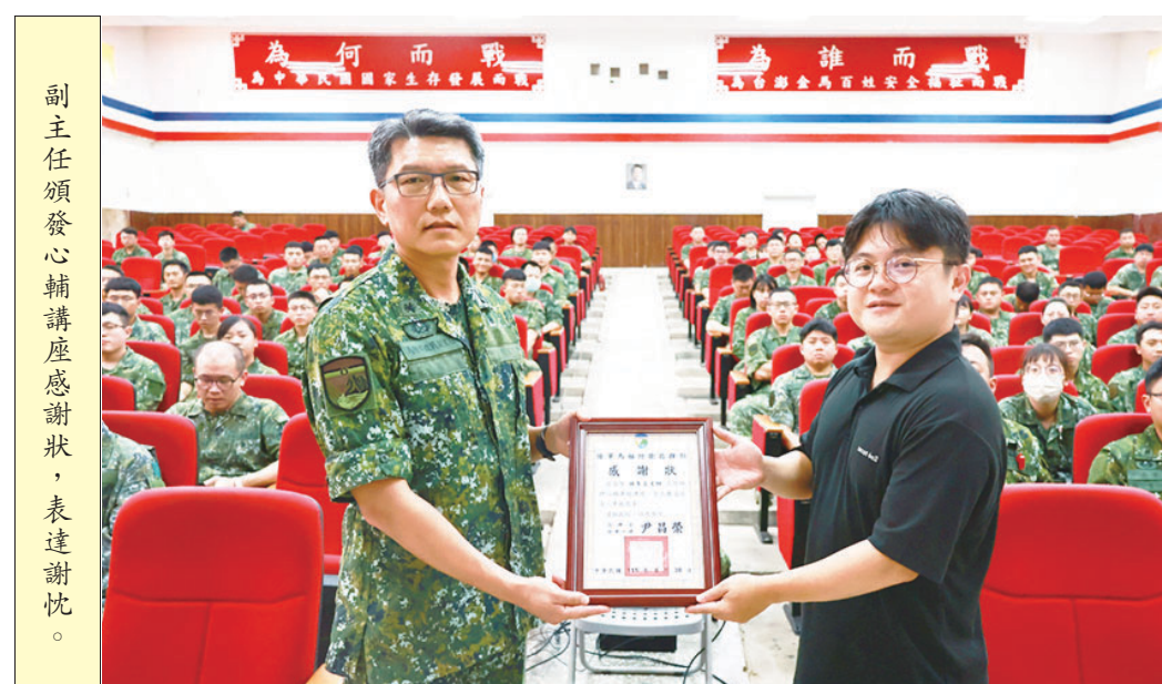
副主任頒發心輔講座感謝狀，表達謝忱。

品戰害部隊。另月會後亦安排心理輔導講座，透過專業宣教協助官兵建立正向心理調適觀念，提升心理韌性與壓力管理能力。