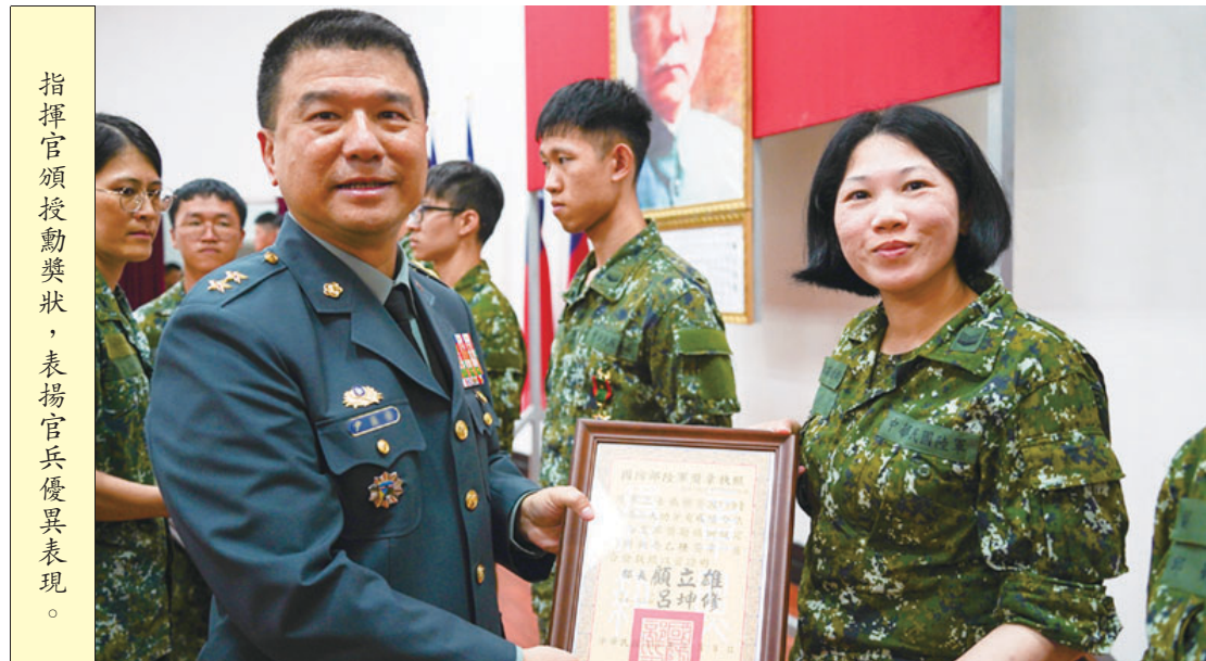
指揮官頒發勳獎狀，表揚官兵優異表現。