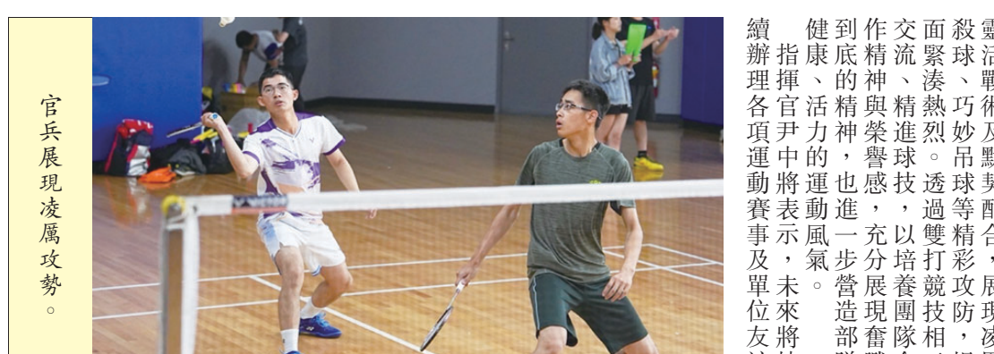
官兵展現凌厲攻勢。

【特約記者林哲良／北竿報導】為強化地區守備防衛能力，北高守備大隊機步連日前實施戰備偵巡，透過模擬多元威脅情境，強化官兵臨戰反應與戰鬥能力。