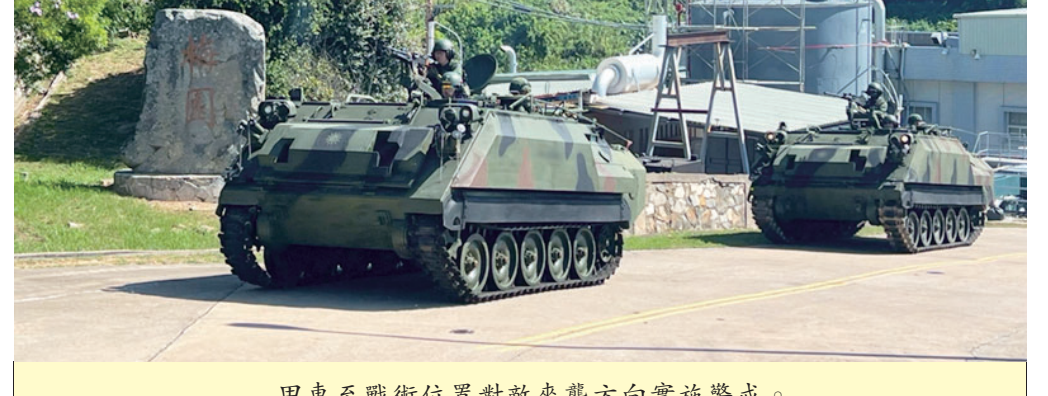
甲車至戰術位置對敵來襲方向實施警戒。

【特約記者張玄德／莒光報導】莒光守備大隊步兵連為強化戰備整備及機動應變能力，近期實施戰備裝載暨戰備偵巡訓練，官兵依令迅速完成人員、武器、彈藥及各項裝備整備。