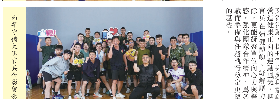
南竿守備大隊官兵合影留念。

【特約記者張玄德／莒光報導】莒光守備大隊步兵連為強化戰備整備及機動應變能力，近期實施戰備裝載暨戰備偵巡訓練，官兵依令迅速完成人員、武器、彈藥及各項裝備整備。