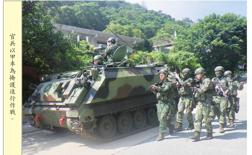
官兵以甲車為掩護進行作戰。

【特約記者林哲良／北竿報導】為強化地區守備防衛能力，北高守備大隊機步連日前實施戰備偵巡，透過模擬多元威脅情境，強化官兵臨戰反應與戰鬥能力。