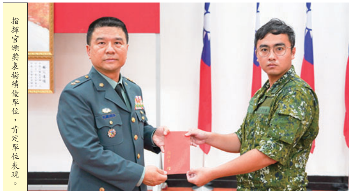
指揮官頒發表揚績優單位，肯定單位表現。

【特約記者蘇郁權／南竿報導】馬防部日前舉行6月份月會，由指揮官尹中將主持。會中除表揚官兵及各類成效良好單位與個人外，也勉勵全體官兵持續精進戰備，精進本職學能，為防區戰備整備共同努力。