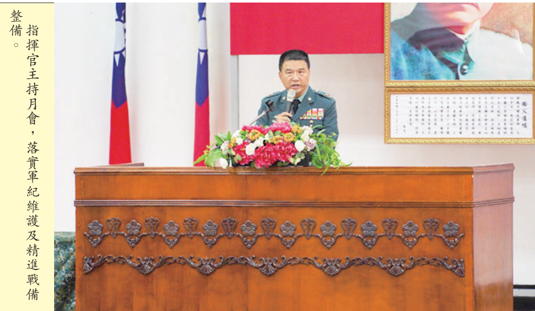
指揮官主持月會，落實軍紀維護及精進戰備整備。

【特約記者蘇郁權／南竿報導】馬防部日前舉行6月份月會，由指揮官尹中將主持。會中除表揚官兵及各類成效良好單位與個人外，也勉勵全體官兵持續精進戰備，精進本職學能，為防區戰備整備共同努力。