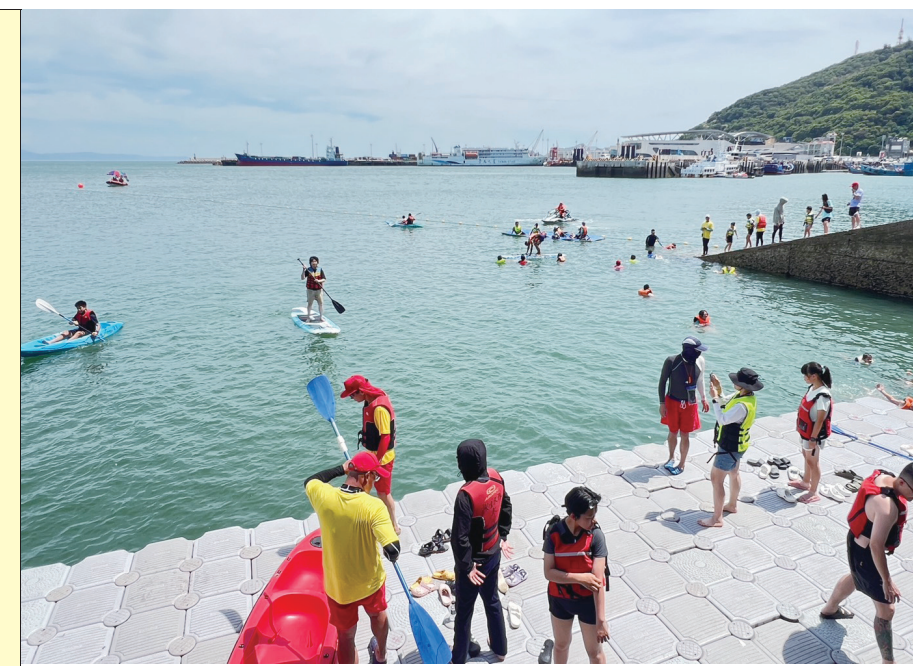
連江縣水上救生協會舉辦海洋多元推廣親子體驗5日在福澳救生大隊廣場歡樂登場。(圖/文：馮紹夫)

【本報訊】連江縣水上救生協會主辦的「運動i臺灣2.0海洋多元親子體驗歡樂登場」活動，5日在水上救生大隊廣場及碼頭熱鬧登場，吸引許多親子家庭踴躍參與。活動結合水域安全宣導與多元水上遊憩體驗，讓民眾在炎熱夏日享受戲水樂趣的同時，也提升水域安全觀念。 夏季是戲水旺季，為推廣正確的水域安全觀念，連江縣水上救生協會透過運動i臺灣2.0計畫，規劃海洋多元活動，希望鼓勵民眾走出近海洋、認識海洋，並在實際體驗中建立正確的水域安全知識。 活動首先由水上救生大隊進行水域安全教育宣導，向大小朋友說明戲水應注意事項、自救與救人觀念，以及穿著救生衣的重要性，提醒民眾從事水域活動時務必做好安全防護，降低意外發生風險。 在水上遊憩體驗中，現場提供立式划槳(SUP)、獨