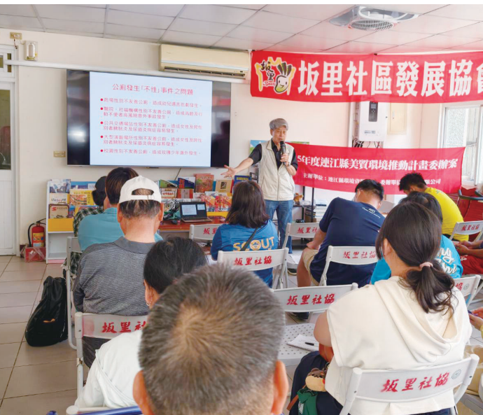
環資局4日於北竿坂里老人活動中心舉行性別友善廁所推廣說明會，邀請陳海曙副教授主講，從實際使用需求出發，與鄉親分享友善廁所規劃與安全觀念。（圖/文：鄭禮頭）

（記者鄭禮頭報導）連江縣政府環境資源局4日上午於坂里老人活動中心舉辦「性別友善廁所推廣說明會」，邀請陳海曙副教授主講，從實際使用需求出發，與鄉親分享友善廁所規劃與安全觀念。（圖/文：鄭禮頭）