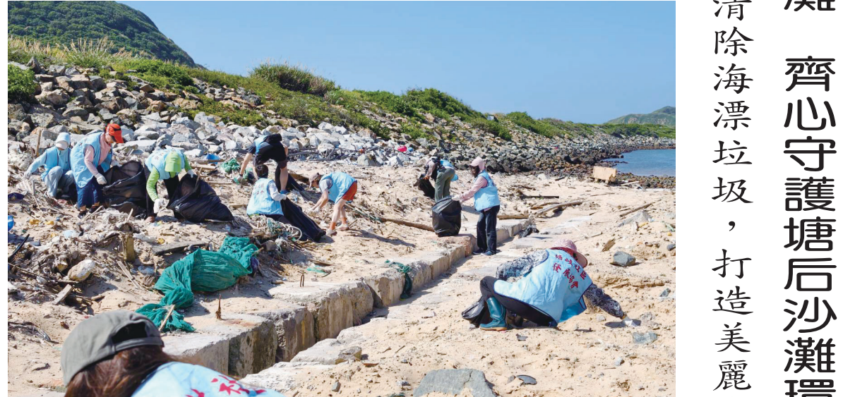
塘岐社區發展協會4日下午號召社區居民及志工前往塘后沙灘淨灘，大家分工撿拾海漂垃圾及廢棄物，以實際行動維護海岸環境。（圖/文：鄭禮頭）

（記者鄭禮頭報導）為維護海岸環境整潔，塘岐社區發展協會4日下午號召社區居民及志工前往塘后沙灘淨灘，大家分工撿拾海漂垃圾及廢棄物，以實際行動維護海岸環境。（圖/文：鄭禮頭）