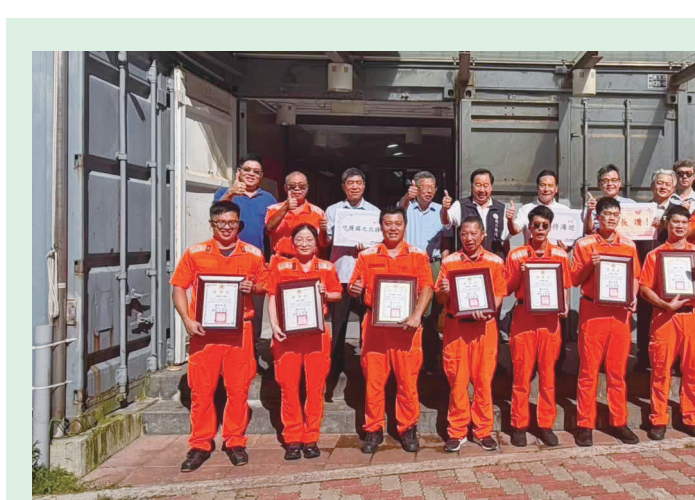
馬祖海巡隊今年及去年共9位同仁考取中央警察大學，縣長王忠銘及議長張永江等人嘉勉同仁戮力公務之餘，仍持續進修不輟。

北竿義消常年訓練 強化公共場所救災應變 實兵操演精進火災搶救能力，守護民眾生命財產安全 【記者鄭禮顯報導】為提升應變能力，連江縣消防局日前結合義勇消防人員，於北竿義消常年訓練場，透過模範公共場所實兵操演，精進火災搶救能力，守護民眾生命財產安全。 演習內容包括：火警接獲、出動、現場搶救、撲滅、撤離、善後處理等。消防人員先針對各項操作重點逐一講解與演習，並由現場指揮官進行實兵操演。演習中，消防人員先針對各項操作重點逐一講解與演習，並由現場指揮官進行實兵操演。演習中，消防人員先針對各項操作重點逐一講解與演習，並由現場指揮官進行實兵操演。