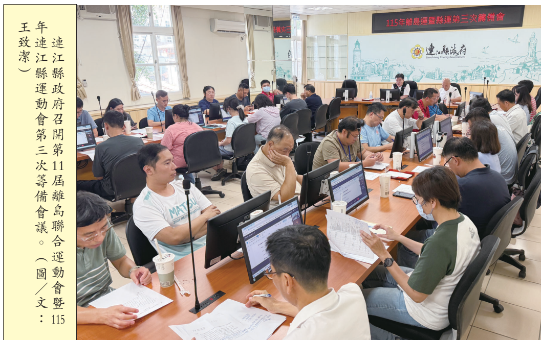
連江縣政府召開第11屆離島聯合運動會暨115年連江縣運動會第三次籌備會議。(圖/文：王致潔)