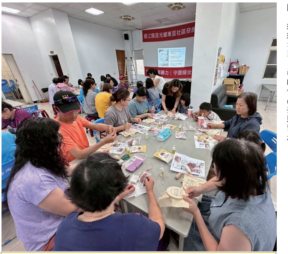
東莒社區發展協會 27 日下午舉辦戮戮繡鑰匙圈 DIY 暨兒童安全宣導活動，吸引不少鄉親及親子熱情參與。

「文化在路上」系列活動透過走讀、搭船及老照片等不同形式，引領民眾從多元視角認識馬祖文化。一場將於7月11日在南竿登場，將帶領民眾手持老照片走訪介壽村街區，對照今昔景貌，回顧聚落發展與生活記憶，持續串連地方文化故事，讓更多人重新認識馬祖的人文風景。