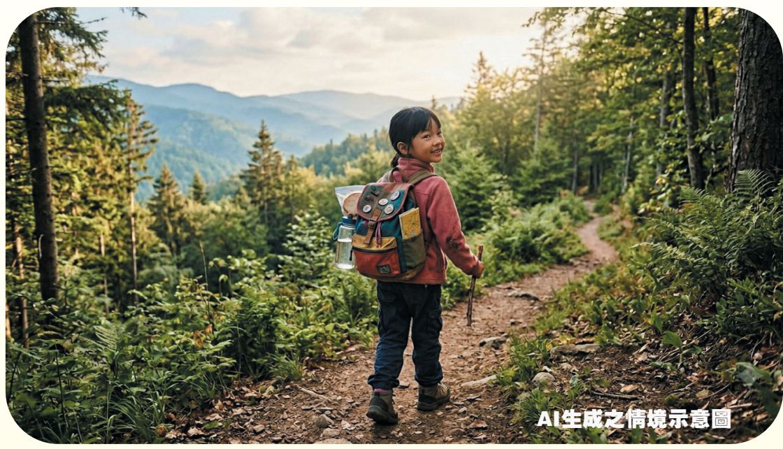
AI生成之情境示意圖