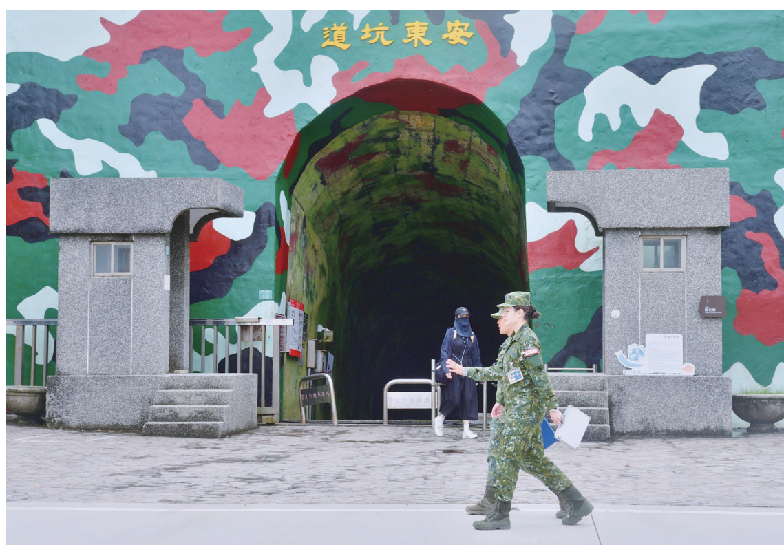
東引安東坑道配合軍方辦理整修工程，考量施工安全及旅遊品質，自7月1日起暫停對外開放，完工後將另行公告開放時間。(圖：資料照片)

【本報訊】東引知名景點安東坑道因配合軍方整修工程，考量施工期間遊客安全及旅遊環境品質，自7月1日起暫停對外開放，完工後將另行公告恢復開放時間。 安東坑道原為軍事戰備設施，後移撥由馬祖國家風景區管理處經營管理，開放作為戰地觀光景點。然而，安東坑道雖已轉型為觀光據點，因應國防安全與軍事任務需求，仍保留預備軍事指揮所功能，必要時須配合部隊運用與整備作業，兼具觀光與戰備雙重角色。 根據了解，此次辦理的「安東坑道預備指揮所整修工程」，由陸軍東引地區指揮部主辦，施工期間自15年5月4日起至9月30日止，主要進行預備指揮所相關空間整修，包括坑道內廁所、作戰室、彈藥室及中心倉庫等設施更新，以維持軍事坑道運作機能。 由於工程期間正值東引旅遊旺季，馬管處東引遊客中心曾與東引地區指揮部及承攬廠商多次協調，希望在兼顧軍事工程需求下，維持安東坑道正常開放，並建議工程車輛、機具移動及建材搬運避開遊客參觀時段，或安排於無旅客進入期間進行，同時提出延後施工的建議，以減少對觀光活動的影響。 不過，承攬廠商表示，無法保證施工期間能完全配合相關調度；東引地區指揮部則基於工程進度與戰備任務需求，亦有如期執行整修工作的壓力。經綜合評估後，考量施工期間工程車輛頻繁進出坑道，將產生廢氣排放、噪音干擾，且機具作業及建材搬運亦可能增加遊客受傷風險，基於維護旅遊安全與健康，決定自7月1日起全面封閉安東坑道。 馬管處表示，安東坑道兼具戰地文化展示與軍事設施特性，在觀光發展與國防需求之間，需取得適當平衡。此次暫停開放，雖對暑期旅遊造成部分影響，但整修完成後，除可提升預備指揮所設施品質，也將提供更完善、安全的參觀環境，讓這處兼具歷史意義與戰地特色的重要景點，以更好的面貌重新迎接遊客到訪。