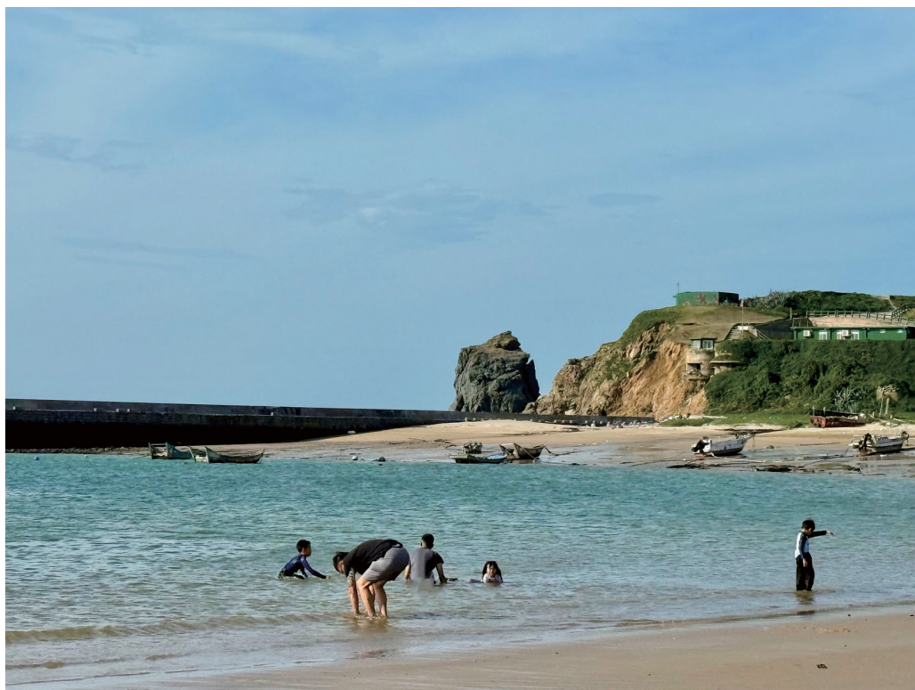
端午連假首日，東莒福正沙灘午後湧現人潮，享受悠閒海島時光。(圖/文：蔡夢玲)

【本報訊】東引知名景點安東坑道因配合軍方整修工程，考量施工期間遊客安全及旅遊環境品質，自7月1日起暫停對外開放，完工後將另行公告恢復開放時間。 安東坑道原為軍事戰備設施，後移撥由馬祖國家風景區管理處經營管理，開放作為戰地觀光景點。然而，安東坑道雖已轉型為觀光據點，因應國防安全與軍事任務需求，仍保留預備軍事指揮所功能，必要時須配合部隊運用與整備作業，兼具觀光與戰備雙重角色。 根據了解，此次辦理的「安東坑道預備指揮所整修工程」，由陸軍東引地區指揮部主辦，施工期間自15年5月4日起至9月30日止，主要進行預備指揮所相關空間整修，包括坑道內廁所、作戰室、彈藥室及中心倉庫等設施更新，以維持軍事坑道運作機能。 由於工程期間正值東引旅遊旺季，馬管處東引遊客中心曾與東引地區指揮部及承攬廠商多次協調，希望在兼顧軍事工程需求下，維持安東坑道正常開放，並建議工程車輛、機具移動及建材搬運避開遊客參觀時段，或安排於無旅客進入期間進行，同時提出延後施工的建議，以減少對觀光活動的影響。 不過，承攬廠商表示，無法保證施工期間能完全配合相關調度；東引地區指揮部則基於工程進度與戰備任務需求，亦有如期執行整修工作的壓力。經綜合評估後，考量施工期間工程車輛頻繁進出坑道，將產生廢氣排放、噪音干擾，且機具作業及建材搬運亦可能增加遊客受傷風險，基於維護旅遊安全與健康，決定自7月1日起全面封閉安東坑道。 馬管處表示，安東坑道兼具戰地文化展示與軍事設施特性，在觀光發展與國防需求之間，需取得適當平衡。此次暫停開放，雖對暑期旅遊造成部分影響，但整修完成後，除可提升預備指揮所設施品質，也將提供更完善、安全的參觀環境，讓這處兼具歷史意義與戰地特色的重要景點，以更好的面貌重新迎接遊客到訪。