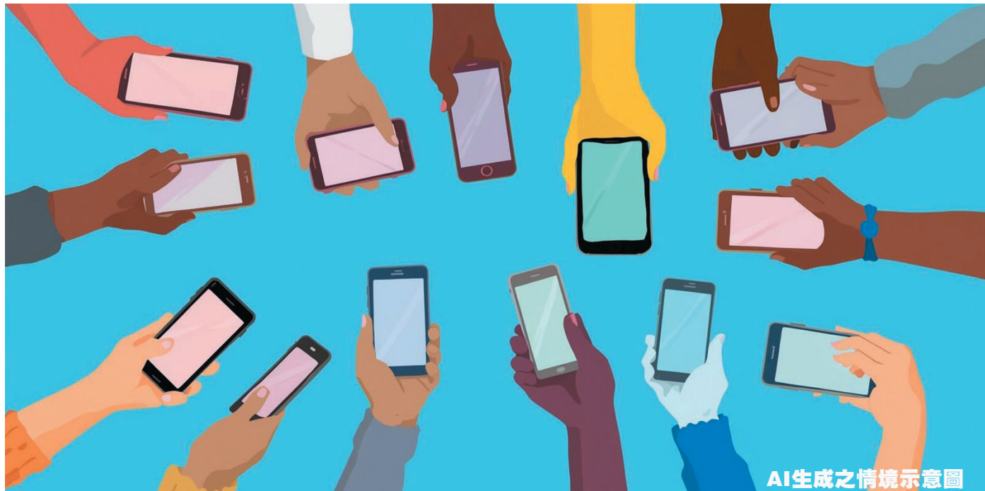
AI生成之情境示意圖

隨著現代文明的發展，許多改變人類生活的發明相繼誕生，其中我認為影響最深遠的，還是娛樂與學習方面，手機早已深深融入我們的日常生活，成為不可或缺的工具。 首先，手機最早的功能是聯繫彼此。從過去的撥打電話、傳送簡訊，到現在的即時通訊軟體，只要透過網路就能與親朋好友保持聯繫，即使相隔千里也能像面對面一樣聊天。此外，手機也能解決許多突發狀況，例如遇到危險時能夠打電話求救，或是臨時需要聯絡家人，手機都發揮了極大的幫助。 再者，手機也是一座知識的寶庫。藉由瀏覽器或各種應用程式，我們可以隨時隨地查詢資料、觀看新聞、學習新知，甚至參與線上課程。只要動動手指上網查閱，許多難題很快就迎刃而解。 然而，手機雖然便利，卻也帶來了一些困擾。過度依賴手機會影響人際關係與生活作息，常常見到朋友聚會時，大家卻只是低頭滑手機，彼此的心距離反而變得更疏遠。此外，沉迷於小螢幕也可能損害視力與健康。因此我認為，當我們享受手機帶來的好處時，也要懂得自律，適當控制使用時間。手機的發明徹底改變了我們的生活模式，它讓世界變得更緊密，讓知識更加普及，也讓我們生活更加便利。對我來說，手機不只是通訊工具，更是學習時代最偉大的發明之一。