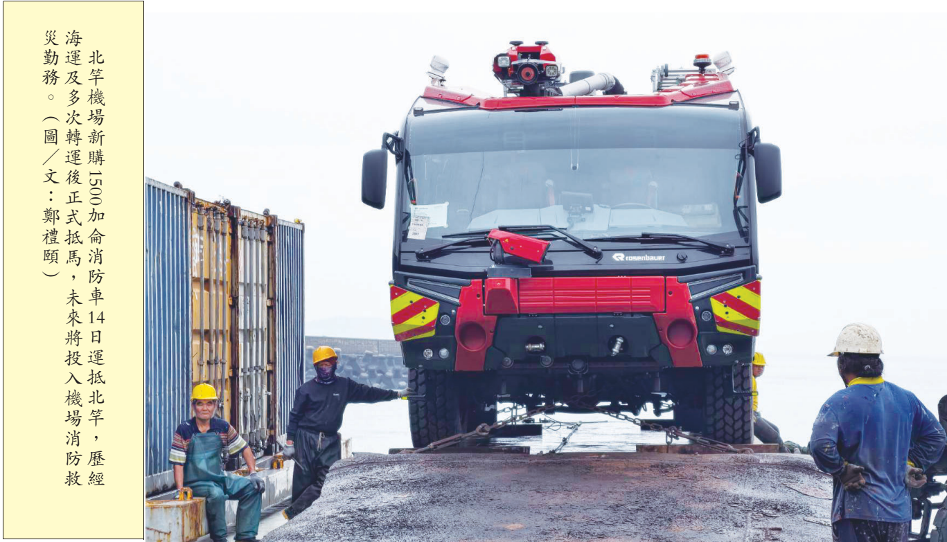
北竿機場新購1500加侖消防車14日運抵北竿，歷經海運及多次轉運後正式抵馬，未來將投入機場消防救災勤務。