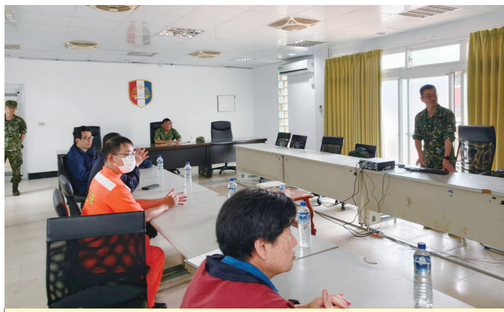
北高守備大隊14日上午於迎賓館2樓辦理15年第二季雲臺操演實彈射擊說明會，向地方說明射擊規劃及相關安全管制作業。(圖/文：鄭禮頤)

【記者鄭禮頤報導】北高守備大隊15年第二季雲臺操演實彈射擊說明會，於14日上午在迎賓館2樓舉行，向地方說明月底射擊規劃、海域管制範圍及相關安全措施，北高守備大隊15年第二季雲臺操演實彈射擊說明會，於14日上午在迎賓館2樓舉行，向地方說明月底射擊規劃、海域管制範圍及相關安全措施，北高守備大隊15年第二季雲臺操演實彈射擊說明會，於14日上午在迎賓館2樓舉行，向地方說明月底射擊規劃、海域管制範圍及相關安全措施。