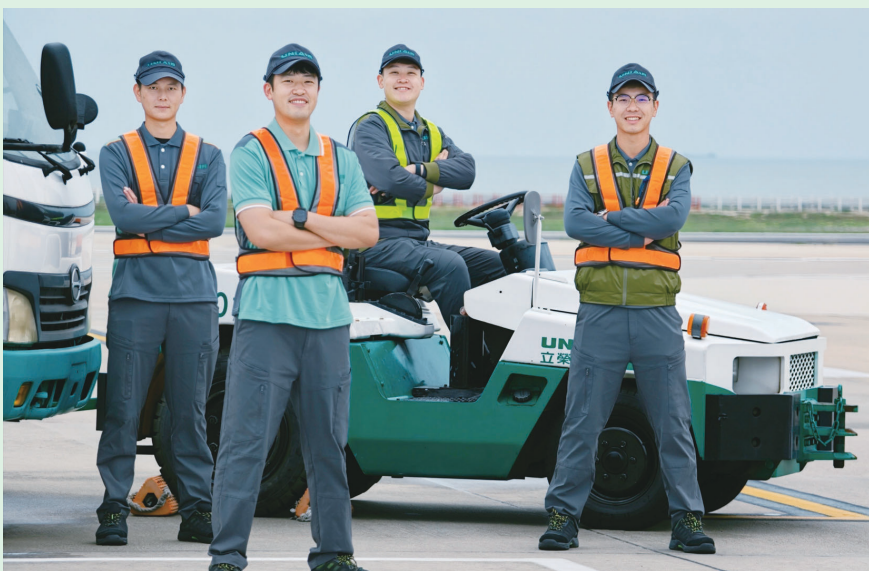
立榮航空勤務團隊更換新制服，結合企業形象與實務需求，展現專業服務形象。

【本報訊】立榮航空15日宣佈，勤務團隊即日起全面換穿全新制服，包含機坪作業、行李託運、運勤服務、立榮航空第一線同仁。立榮航空表示，新制服上線除著重機能與作業便利性，展現專業形象與實務需求，展現專業服務形象。 立榮航空表示，新制服上線除著重機能與作業便利性，展現專業形象與實務需求，展現專業服務形象。立榮航空表示，新制服上線除著重機能與作業便利性，展現專業形象與實務需求，展現專業服務形象。