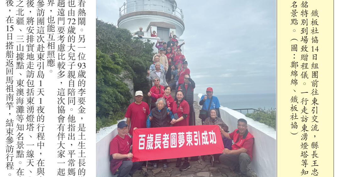
鐵板社協14日組團前往東引交流，縣長王忠銘特別到場致贈贈儀。一行走訪東湧燈塔等知名景點。

【本報訊】上海日前公布，4月29日起上海居民可透過上海市、福建省具備相關資質(資格證書)的旅行社報名個人遊。據了解，首個上海團10餘人，對於已經結束遊程返陸，對於未來上海團客來馬旅遊，地區業者表示樂觀其成。 據陸媒相關報導指出，上海全市20個出入境接待大廳已同步啟動赴金門、馬祖旅遊簽證申請受理工作，上海市戶籍居民和居住證持有者，憑本人有效身分證、申請辦理往來台灣通行證，及赴金門、馬祖個人旅遊簽證或團隊旅遊簽證。在福建的上海市戶籍居民，也可向福建省公安機關出入境管理機構，申請辦理上述證件及簽注。 地區旅遊業者指出，上海旅遊團在行程規劃上與一般陸團有所差異，主要規劃4到5天行程，且餐標、住宿品質都比一般陸團要求來得更高，一般即需要更精緻且高品質的旅遊規劃。 業者也表示，任何對於觀光發展有利的政策，我們都樂見其成，希望能藉此活絡地方旅遊商機。