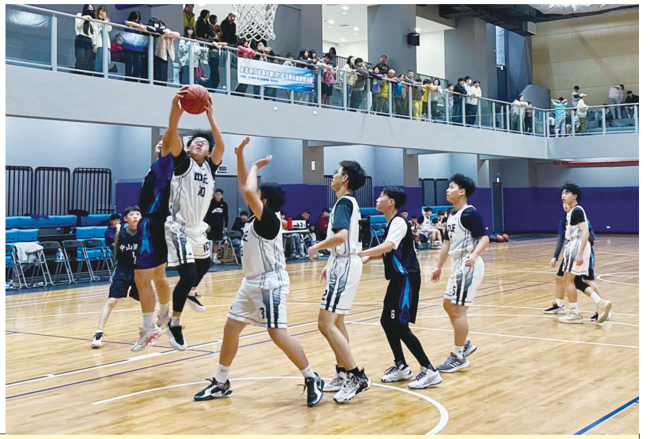
樂活體育館自今年1月推動學生優惠方案以來，共有1,016人次入館，有效提升學子運動風氣。(圖/文：王致潔)