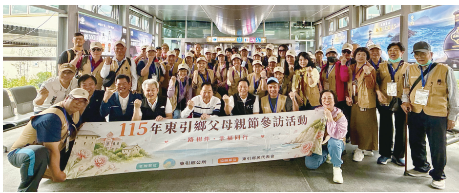
東引鄉父母親節參訪活動13日正式出發，縣長王忠銘、議長張永江前往送行並致贈程儀，祝旅途平安順利。(圖/文：王致潔)

【本報訊】東引鄉115年父母親節參訪活動昨(13)日正式啟程，由鄉長林德建率領80位鄉親跨海赴陸，展開5天4夜交流行程。縣長王忠銘、議長張永江等特親臨碼頭，與參訪團成員一一合影，並致贈程儀，預祝旅途圓滿順利。