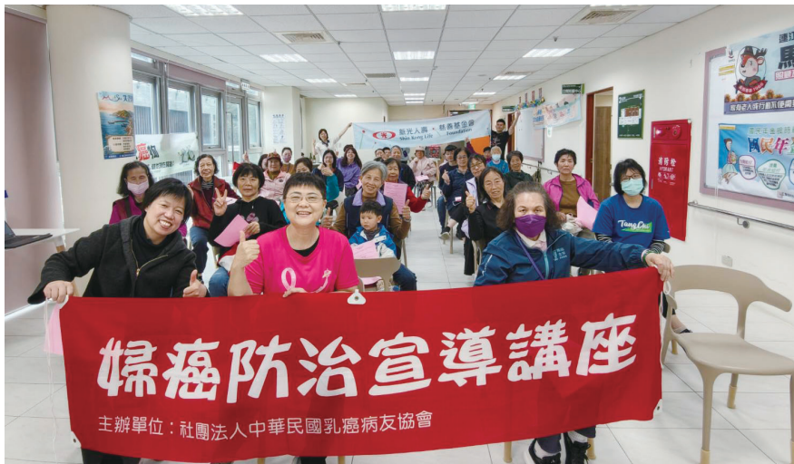
連江縣衛生局邀請中華民國乳癌病友協會前往北竿辦理婦癌防治宣導講座，透過病友分享及互動教學，提升民眾對婦癌防治與定期篩檢的認識。