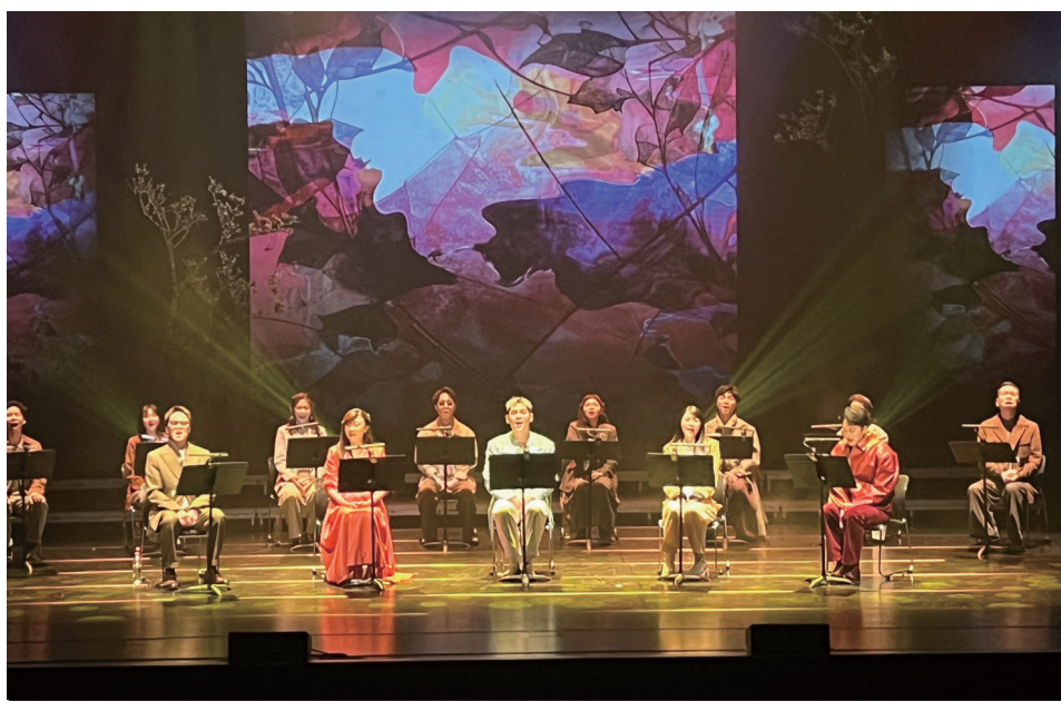
民歌音樂會《微風往事》梅石演藝廳演出，經典民歌喚起民眾回憶，精彩演出獲得觀眾好評。(圖/文：馮紹夫)