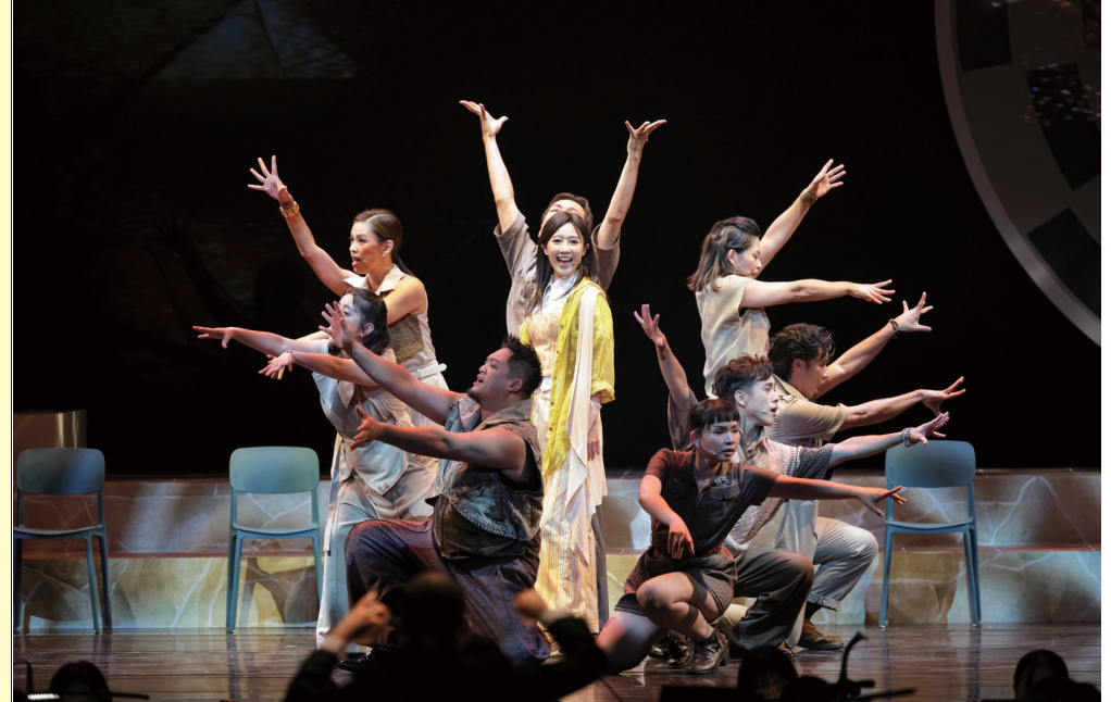
由愛樂劇工廠打造的經典民歌音樂會《微風往事》，將於5月9、10日在馬祖梅石藝文中心隆重登場，即日起開放售票。

【本報訊】由愛樂劇工廠打造的經典民歌音樂會《微風往事》，將於2025年5月9、10日(六、日)在「馬祖梅石藝文中心」隆重登場。售票自今(30)日上午8時起於「Fun售票系統」(https://fun2.me/25a839)正式啓動，誠摯邀請鄉親與遊客走進梅石，共賞美好樂章。 連江縣政府文化處表示，期盼透過民歌傳唱不輟的旋律，連結在地居民的情感記憶，讓藝術真正走入馬祖大眾的生活。 為了慶祝場館啓用並落實文化平權，本次演出推出「試營運期間限定優惠」：一般民眾購票即享6折，團體推廣享5.5折，設籍連江縣之縣民更享5折超值回饋；此外，針對65歲以上長者、學生及身心障礙朋友，更推出「免費入場」的愛心專案，鼓勵全家大小共享藝術饗宴。 《微風往事》源於愛樂劇工廠經典作品，以1970至