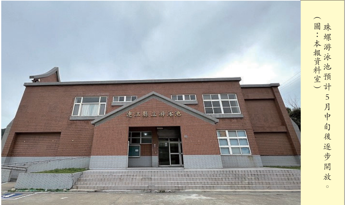
珠螺游泳池預計5月中旬後逐步開放。

【本報訊】原訂5月1日開放的南竿珠螺游泳池，經縣府整體評估後，考量5月初氣候仍偏涼、水溫較低，且各校游泳課程尚未正式展開，相關救生與管理人力亦須依實際使用需求進行調度，預計延到5月中旬後逐步開放。 教育處表示，目前已初步規劃，將於5月中旬後視天候逐漸轉暖情形，優先評估採取試辦方式，於週六、週日開放部分時段，暫定開放時間為下午13時至17時及晚間22時至21時；晚間21時至22時則安排進行場地整理及水質維護作業，以確保使用安全與環境品質。 另隨著7月暑假到來，游泳池將恢復全面開放，開館時間規劃為每週三至週日，提供民眾更完整的休閒與運動空間。 教育處強調，相關開放時程將持續視天候與整體條件滾動檢討，並感謝鄉親的體諒與支持，未來也將持續努力，讓游泳池在最佳狀態下重新對外開放，兼顧安全與服務品質。