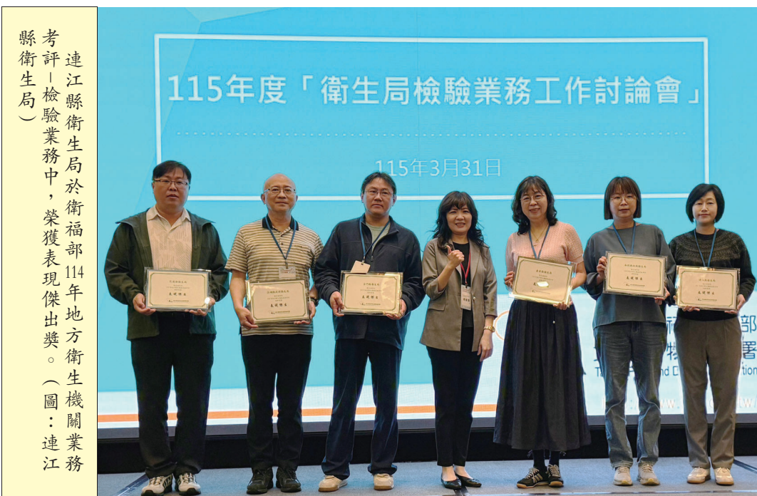
連江縣衛生局於衛福部114年地方衛生機關業務評核中，榮獲表現傑出獎。

【本報訊】連江縣衛生局在衛生福利部「114年地方衛生機關業務評核」中，憑藉專業的檢驗技術與嚴謹的品質管控，榮獲「表現傑出獎」，充分體現檢驗團隊專業能力及成效。 連江縣衛生局不僅是衛福部食品藥物管理署(FDA)認證的合格實驗室，更通過英國FAPAS及食藥署的檢驗能力試驗。此次獲頒「表現傑出獎」，代表衛生局在檢驗品質、技術能力、輔助計畫及分工等各項指標上，均展現出卓越專業水準。 隨著國內食安意識抬頭，中央與地方主管單位不斷加強把關與監督，且推動各項食安改革及管理政策。衛生局指出，為維護縣民食安，衛生局持續強化實驗室檢驗能力，並持續參與認證，以確保檢驗品質與食安守門人崗位、默默為民眾健康把關的檢驗團隊最真實的鼓勵。 衛生局強調，未來將持續爭取檢驗設備更新經費，並精進各項檢驗技術，加強跨單位的檢驗合作，秉持專業與精準的精神，為連江縣的食安把關持續努力，讓鄉親吃得安心。