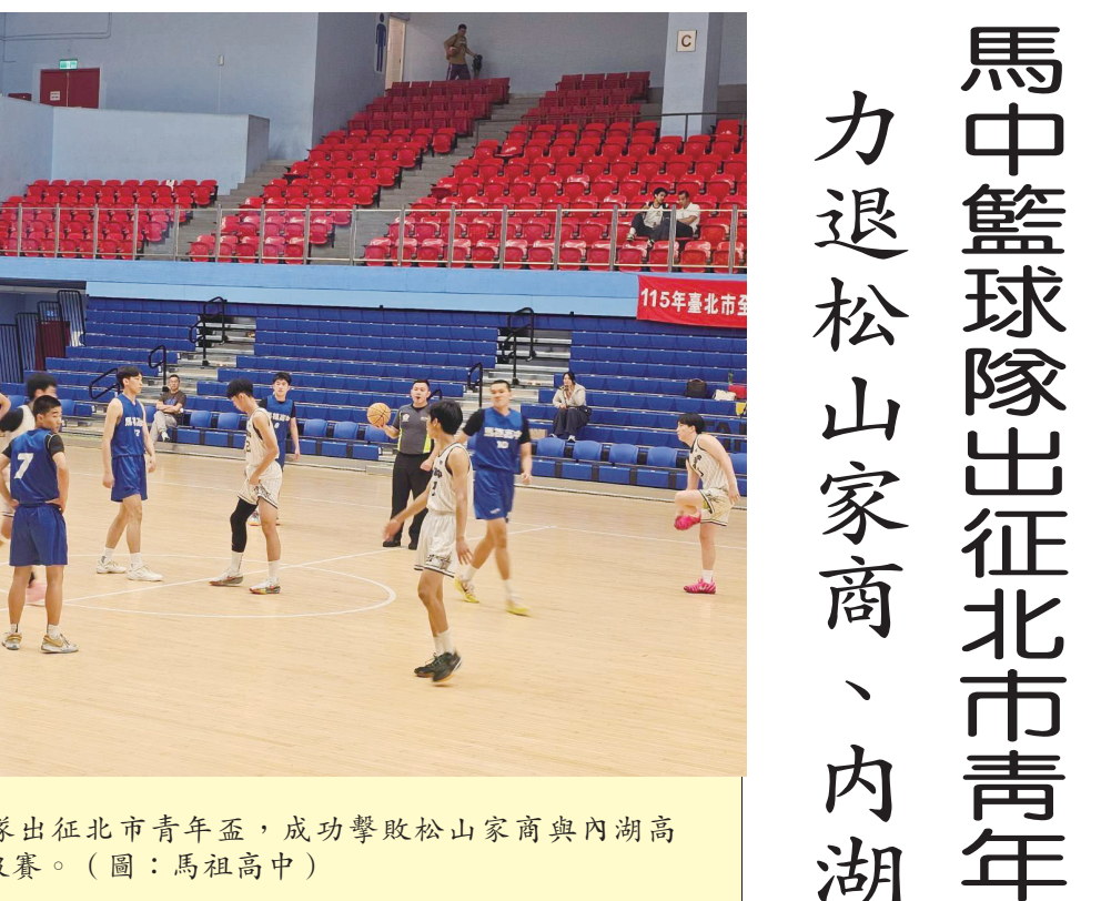
馬中籃球隊出征北市青年盃，成功擊敗松山家商與內湖高中，挺進晉級賽。