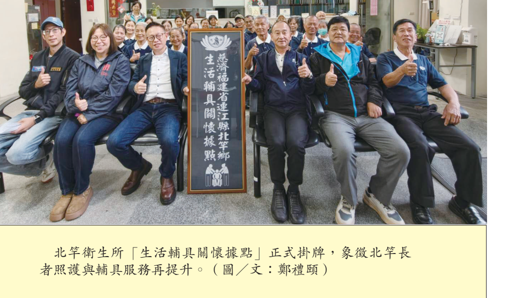
北竿衛生所「生活輔具關懷據點」正式掛牌，象徵北竿長者照護與輔具服務再提升。(圖/文：鄭禮頤)