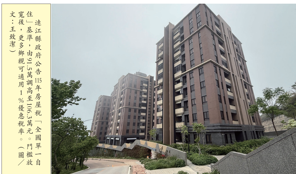
連江縣政府公告115年房屋稅「全國單一自住」基準，由50.5萬調高至106.3萬元。門檻放寬後，更多鄉親可適用1%優惠稅率。(圖/文：王致潔)

【記者王致潔報導】連江縣政府公告更新115年期房屋稅「全國單一自住」房屋現值一定金額基準，由原先的50萬5,000元調高至106萬3,000元。這意味著門檻放寬，更多鄉親將有機會適用更優惠的1%房屋稅率；若未符合此優惠條件者，則適用一般自住稅率1.2%。算本縣排除戶數為68戶(274*0.3%)，公告金額取274戶中的第一戶，訂為106萬3,000元。 換句話說，目前本縣所有符合單一自住條件的274戶，其房屋現值均未超過此門檻，只要在3月22日辦妥戶籍，115年度全數皆可享有1%優惠稅率。至於116年後的基準，將再依當年度實際戶數重新計算公告。 縣府呼籲，請鄉親把握時間檢視自家房屋現值與戶籍狀況，若有任何疑問，可洽詢財稅局，確保減稅權益不受損。