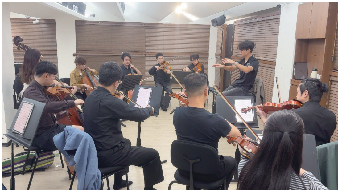
聯發科技攜手灣聲推動藝文扎根，4月17日於梅石藝文中心、19日於東引忠誠門舉辦共鳴音樂會，並規劃多場在地快閃與鄉親互動。

【記者鄭禮頭報導】北竿橋仔村雌光螢，近日在夜間草地間，呈現持續微弱亮光，增添自然魅力。雌光螢多於4至5月進入繁殖期，主要活動時間為晚上7時至8時，具有飛行能力，雌蟲會透過尾部發光吸引雄蟲前來交配。近日於橋仔村機噐入口處發現其蹤跡，與山坡地現有的草叢、灌木等植物，共同構成獨特的生態景觀。北竿春季除了海山賞櫻外，隱藏在草地間同樣不可錯過的生態景觀，為遊客增添不同層次的自然魅力。雌光螢與藍眼淚同為馬祖春季兩大夜間自然景觀，兩者在觀賞的同時，呼籲民眾與遊客觀賞時，避免使用強光照射、勿干擾棲地，以一起守護這難得的自然景觀。