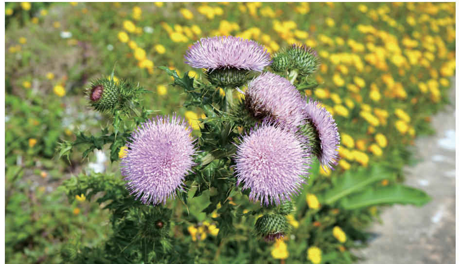
東引南國小薊盛開，紫紅花朵如絨球般綻開，與背景兔兒菜黃花形成鮮明對比。(圖/文：陳其敏)

【本報訊】隨著時序進入四月天，馬祖四鄉五島正悄悄換上春裝。除了「藍眼淚」季節來臨，田野間豐富的植物生態也正精彩上演。近日，馬祖處處可見一叢叢粉紫色、宛如「爆炸頭」的南國小薊(地雷花)迎風盛開，其明艷花姿與渾身銳利的強悍特性，不僅吸引遊客目光，更被公認為與馬祖戰地意象最為契合的代表性植物。 在東引海岸山坡，南國小薊花況尤為旺盛。紫紅花朵如絨球般綻放，隨風搖曳，搭配黃色兔兒菜點綴，形成強烈對比，構成層次豐富的自然畫面。地方人士表示，此時是探索馬祖植物生態的最佳時機，遊客可趁春季走訪各島，感受不同於台灣本島的自然魅力。 南國小薊外型雖明艷動人，但全株佈滿銳利硬刺，葉緣鋸齒狀且帶刺，稍有不慎即可被刺傷。早年駐守馬祖的官兵，因其難以接近且易傷人的特性，形象地稱之為「地雷」，也為這種植物增添幾分戰地色彩，與馬祖昔日軍事重地的氛圍相互呼應。