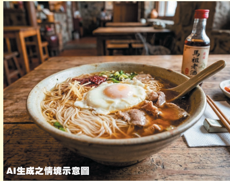
AI生成之情境示意圖

在這片北斗的土地上，處處流淌著故事的力量，而這趟旅程的真諦，就是在欣賞美景的同時，重新找回那珍貴的自我。