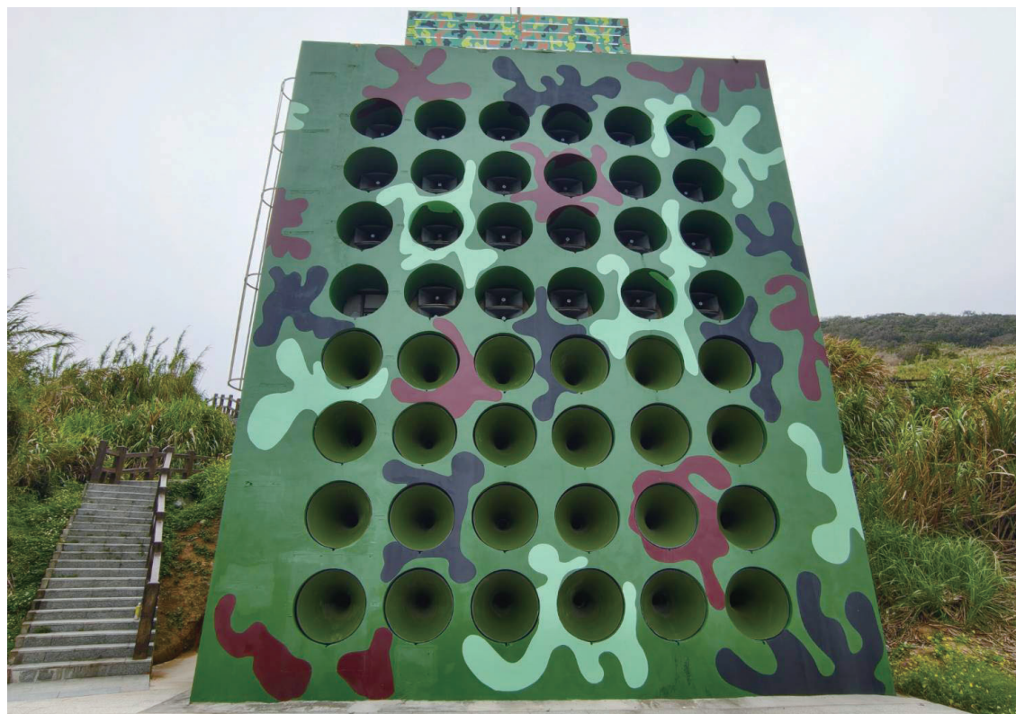
芹壁喇叭牆完成修繕，保留 48 個喇叭孔原貌，呈現戰地歷史意象。(圖/文：鄭禮頤)

【本報訊】馬管處於 14 日舉行修繕完成典禮，由馬管處處長鄭禮頤主持，與會人員包括各鄉鎮長、里長、社區代表及媒體記者等。典禮中，鄭禮頤表示，喇叭牆是戰地歷史的重要見證，此次修繕工程，不僅修復了受損的喇叭孔，更在保留原有歷史氛圍的前提下，進行了整體環境的規劃與提升。後續將針對周邊環境進行整體規劃，提升遊客觀光體驗。