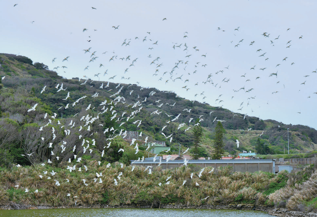
鋒面給東引帶來風雨，也帶來數量龐大過境白鷺鷥。