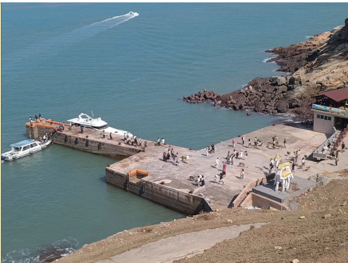
清明連假不少民眾登大坵島踏青賞鹿，上島人數逾700人次。（文：鄭禮頤）

〔記者鄭禮頤報導〕清明連假，不少民眾與遊客把握假期前往大坵島，踏青賞鹿、親近大自然，南北竿登島人數逾700人次，成為連假熱門景點之一。 依統計，北竿4月3日至6日上午登島人數分別為39人、197人、113人及22人，累計約371人次；南竿則為86人、149人、87人及19人，合計約341人次。整體來看，登島人潮主要集中在連假第二、三天，為整個假期間人數最多。 大坵島以梅花鹿生態聞名，遊客登島後沿著步道前行，不時可見鹿群在草地或林間活動，部分鹿隻主動靠近與遊客互動，成為不少民眾印象深刻的體驗。民眾一邊餵食鹿群、一邊拍照留念，近距離感受自然生態，也讓整個假期行程更有趣。 大坵島已成為連假假期民眾與遊客常安排的行程之一，也為馬祖觀光旅遊帶來人潮與活力。