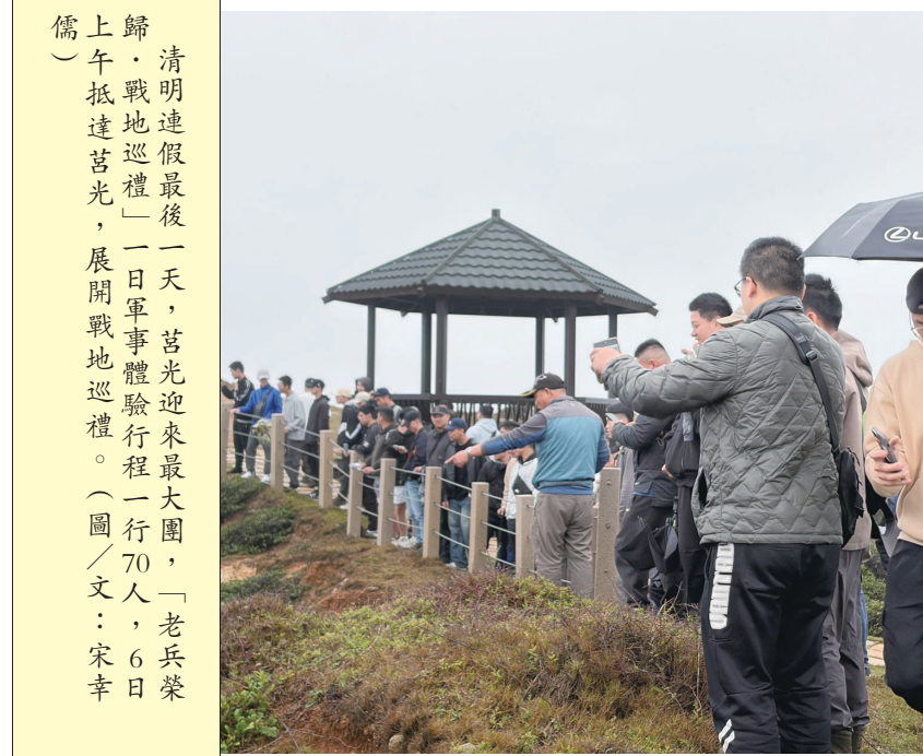
清明連假最後一天，莒光迎來最大團，「老兵榮歸·戰地巡禮」一日軍事體驗行程一行70人，6日上午抵達莒光，展開戰地巡禮。