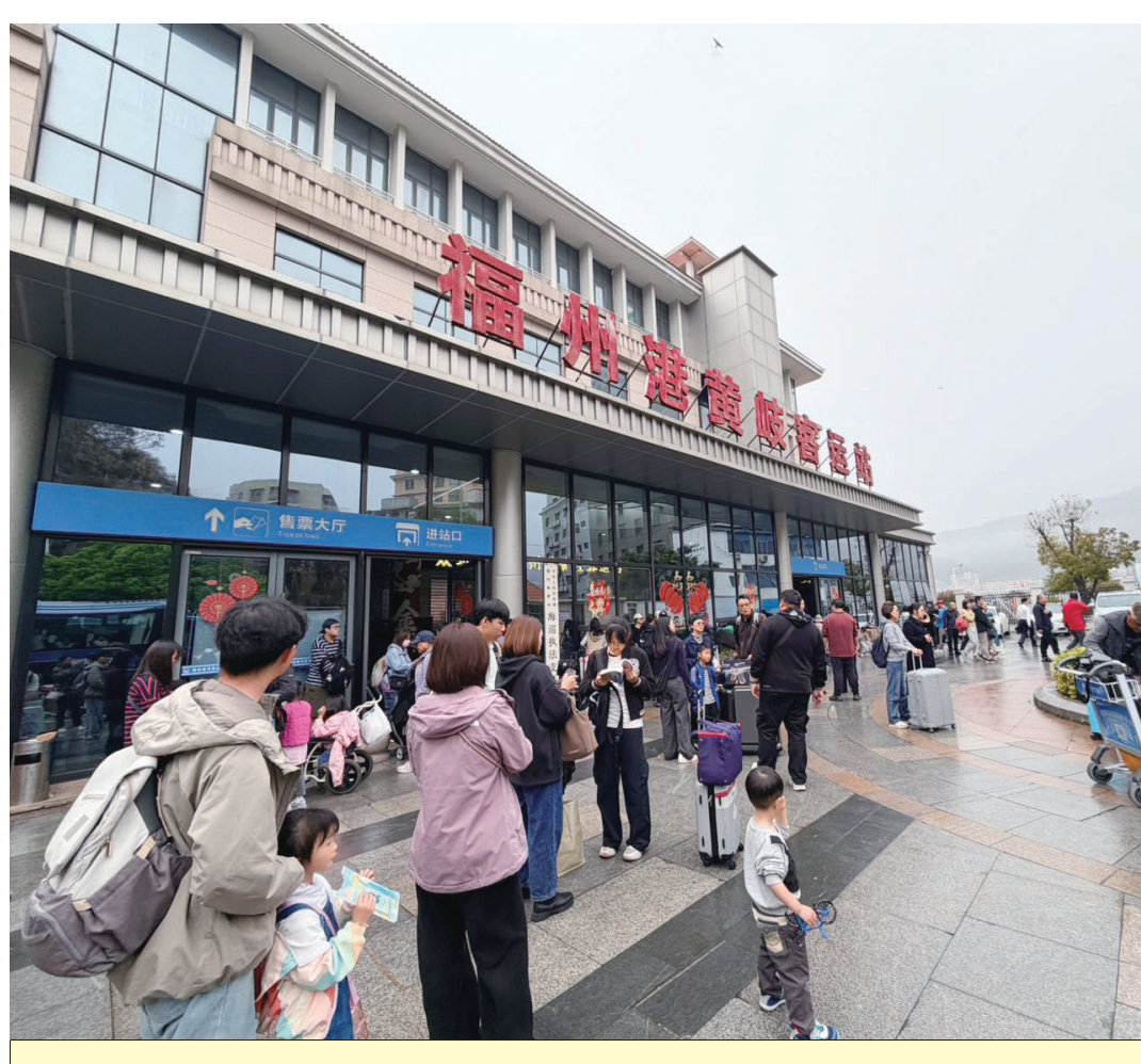
清明收假黃岐港濃霧封港，數百鄉親滯留大陸。

【記者馮紹夫報導】清明連假期間，黃岐港因濃霧封港，數百鄉親滯留大陸。交旅局緊急協調，今日南北海運開3班、程泰2班船班，疏運民衆返鄉。據悉，受霧影響，黃岐港封港，數百鄉親滯留大陸。交旅局緊急協調，今日南北海運開3班、程泰2班船班，疏運民衆返鄉。