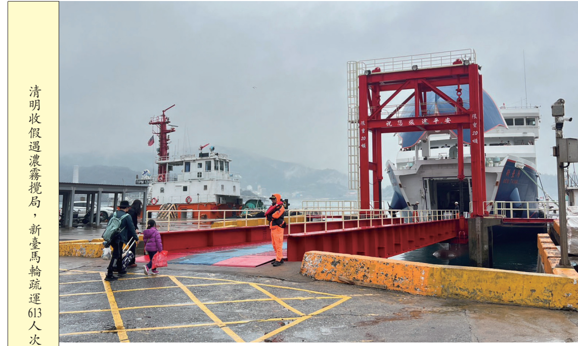
清明收假濃霧攪局，新臺馬輪疏運613人次。

清明收假濃霧攪局 新臺馬輪載運613人抵台 臺馬之星緊急加開，搭載244人返馬，協助鄉親返回工作崗位 【記者馮紹夫報導】清明連假收假首日，黃岐港因濃霧封港，數百鄉親滯留大陸。交旅局緊急協調，今日南北海運開3班、程泰2班船班，疏運民衆返鄉。據悉，受霧影響，黃岐港封港，數百鄉親滯留大陸。交旅局緊急協調，今日南北海運開3班、程泰2班船班，疏運民衆返鄉。