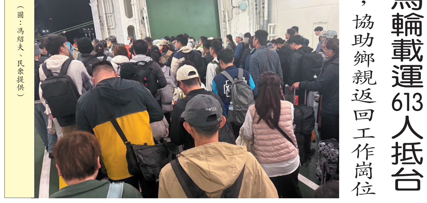
清明連假，東引進出旅客近2000人，新臺馬輪、臺馬之星與南北之星協力，疏運順暢

東引中柱碼頭鋪面更新及擋風牆美化完工 民衆盼儘早恢復貨輪靠泊與裝卸，紓解空間不足問題 【本報訊】東引中柱碼頭水泥鋪面更新工程及軍方船渠周邊擋風牆美化工程，目前已提前完工。據悉，該項工程旨在改善碼頭環境，提升碼頭形象。完工後，將有助於恢復貨輪靠泊與裝卸作業，紓解碼頭空間不足問題。