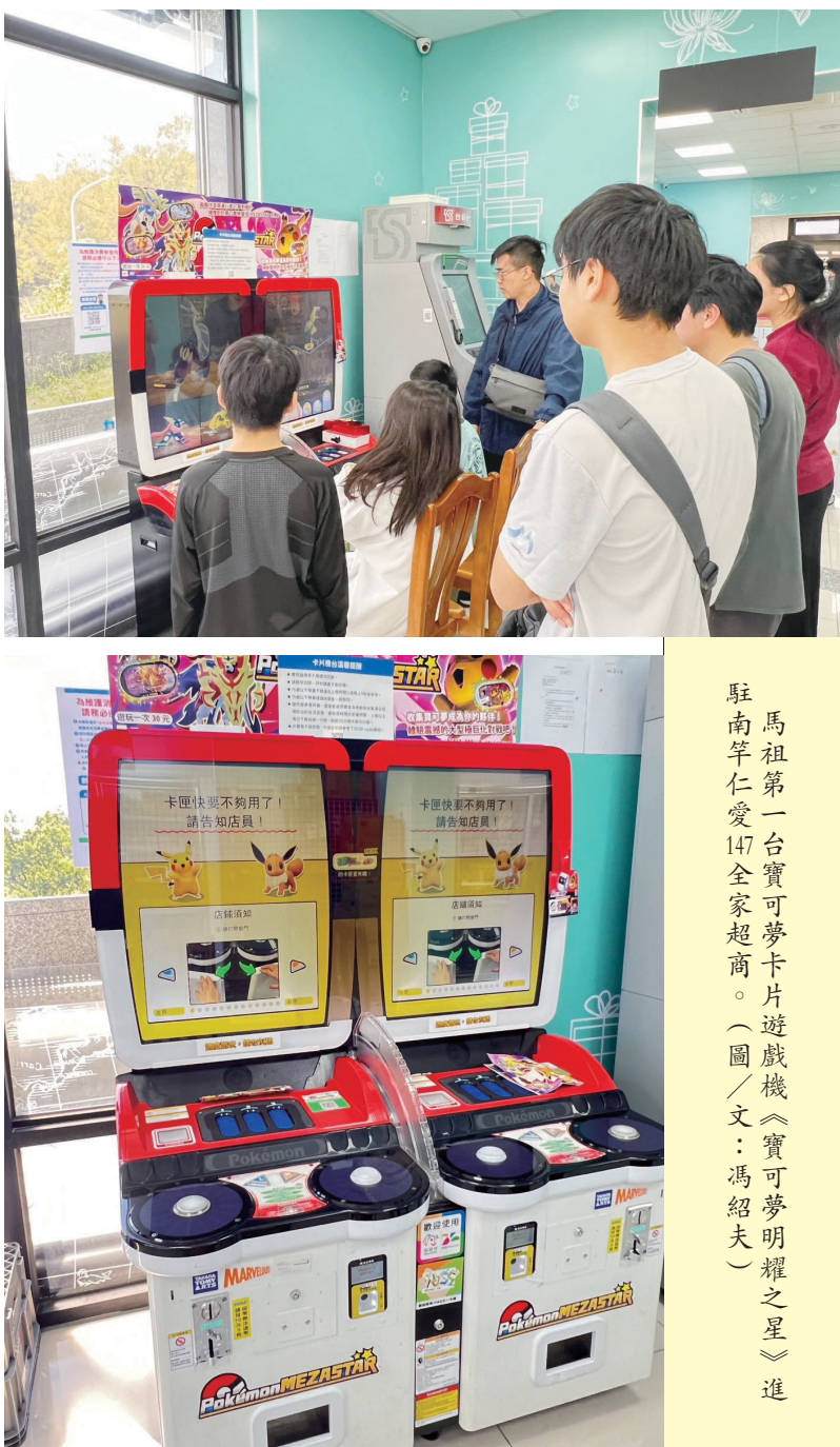
馬祖第一台寶可夢卡片遊戲機《寶可夢明耀之星》進駐南竿仁愛147全家超商。(圖/文：馮紹夫)

【記者馮紹夫報導】寶可夢訓練家集合！馬祖第一台寶可夢卡片遊戲機《寶可夢明耀之星》進駐南竿仁愛147全家超商。消息一出引起軍民關注，業者表示，會由物流持續補充卡片，讓軍民遊玩體驗。 台灣許多商場、超商都有設置「寶可夢明耀之星」大型機台，不時可見遊玩的排隊人龍。現在馬祖終於也有得玩了！全家仁愛147店成功申請機台，開4月初完成安裝上線，開放後立刻吸引大批民眾前來體驗，也確實有玩家打出最高級的「一六星」寶可夢卡片。據聞有一位民眾從早上8時到晚上8時，只要有時間都在店裡遊玩，相當狂熱。 業者指出，遊戲在台灣相當受歡迎，不少軍人、學生都相當熱衷；業者指出，馬祖交通較為不便，需要等待廠商運送卡匣，才能開放遊玩；也提醒小朋友適度遊玩，不要過度沉迷。