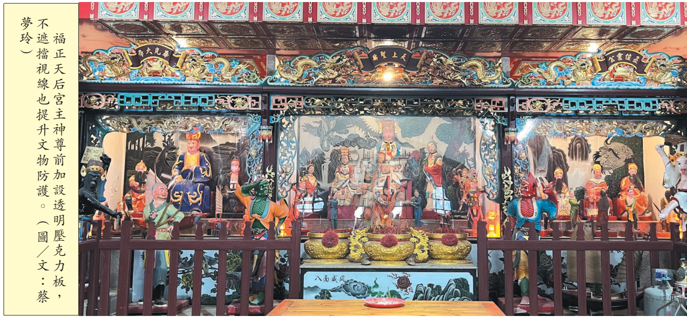
福正天后宮主神尊前加設透明壓克力板，不遮擋視線也提升文物防護。(圖/文：蔡夢玲)

【記者蔡夢玲報導】東莒福正天后宮泥塑神尊已列為文物資產，廟方為降低意外風險，在神尊前方加設透明壓克力板，形成一道不影響參拜視線與「透明牆」。廟方表示，過去曾發生貓爪誤闖入內跳上供桌，意外造成泥塑神尊受損，當下既心疼也提高警覺：文物保存不只靠修復與保養，更需要把可能發生的日常風險先擋下來。為此才以透明隔板方式進行防護，既能維持參拜視線與氛圍，也能降低再次碰撞、踐踏或刮損的風險。 廟方指出，寺廟常年開放、信眾出入頻繁，文物保存除了定期巡察與保養，也需要貼近日常情境的防護設計。透明壓克力板的設置，正是把守護文物落實到每天都會遇到的小細節上；不影響信眾敬拜，卻替列冊文物多加一道防線，也讓這座承載信仰與地方記憶的廟宇，能更穩穩地被看見、被守住。