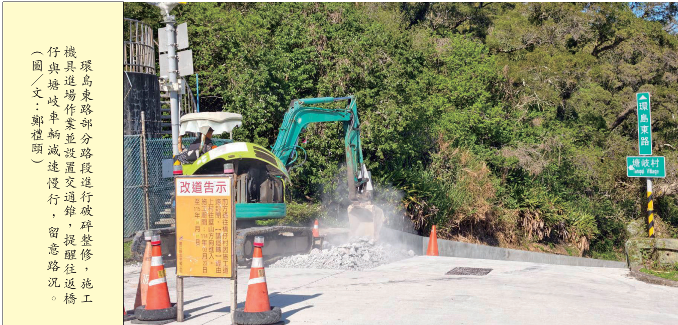
環島東路部分路段進行破碎整修，施工機具進場作業並設置交通錐，提醒往返橋仔與塘岐車輛減速慢行，留意路況。

【本報訊】為提升週日旅客疏運，交旅局於去年執行八趟「臺馬之星」週日夜航，載客率逾四成，有效疏運週日旅客。今年首航將於今晚（5日）由馬祖開往台北，預計將吸引不少旅客搭乘。 財稅局：離島免稅車運往台灣，取消資格並補徵稅款。 【本報訊】為提升週日旅客疏運，交旅局於去年執行八趟「臺馬之星」週日夜航，載客率逾四成，有效疏運週日旅客。今年首航將於今晚（5日）由馬祖開往台北，預計將吸引不少旅客搭乘。