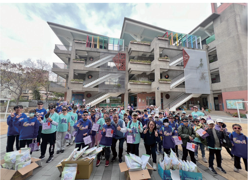
南竿鄉長林志東前往各校發送兒童節禮物。

【本報訊】連江縣環保局表示，近日為掃墓高峰期，今年度台灣本島墓地雜草火災發生頻繁，造成消防人員疲於奔命，呼籲民眾掃墓不用火，4「不」要「原」則，除草「不」用火、紙錢「不」燃燒、爆竹「不」燃放、菸蒂「不」亂丟、垃圾「要」帶走。 環保局提醒，建議民眾採用「以功代金」或「以米代金」等環保祭祀，同樣可表達對先祖的尊敬，獲得庇護，共同為環境減碳減汙盡一份心力。 環保局提醒，任意燒雜草可能違反消防法第14條，野火燃燒申請許可及安全防護相關規定，得處新臺幣3,000元以下罰鍰；而焚燒雜草造成的空氣污染，得依空氣污染防制法第32條及第67條規定處1,200元以上10萬元以下罰鍰；如因放火焚燒雜草而危害公共安全，更有可能觸犯刑法(失)火罪而面臨刑事責任，民眾掃墓祭祖時務必留意，千萬別貪圖方便而觸法。