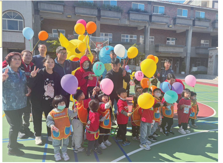
北高守備大隊走訪國小、幼兒園及公托，發送手作餅乾與氣球，並與孩童合影同樂，祝福兒童節快樂。(圖／文：鄭禮頭)

【本報記者鄭禮頭報導】北高守備大隊與志工媽媽們1日下午前往塘岐幼兒園以及公托、塘岐國小，準備手作餅乾與氣球，分送給孩子們，向地方孩童表達兒童節祝福，現場氣氛溫馨熱鬧。 發送行程第一站來到塘岐幼兒園，向小朋友致贈手作餅乾與色彩繽紛的氣球，孩子們收到禮物時臉上洋溢著開心笑容。第二站前往公托，小朋友一一走出教室，步伐搖擺、東張西望，有的需要老師牽著慢慢前進，有的仍需抱在懷中，模樣天真可愛，為現場增添幾分童趣，並同場致贈手作餅乾，氣氛溫馨。 適逢塘岐國小校慶，隨後一行人移往運動場，除祝福學校生日快樂外，軍中弟兄穿上卡通充氣布偶進場，隨著音樂起舞帶動氣氛，老師與學生也一同加入，跟著節奏舞動，現場氣氛更加熱鬧。孩子們手持氣球開心合影，留下難忘回憶。 北高守備大隊表示，透過此次兒童節活動，不僅為孩子們帶來節日驚喜，也展現了軍民合作與在地關懷。