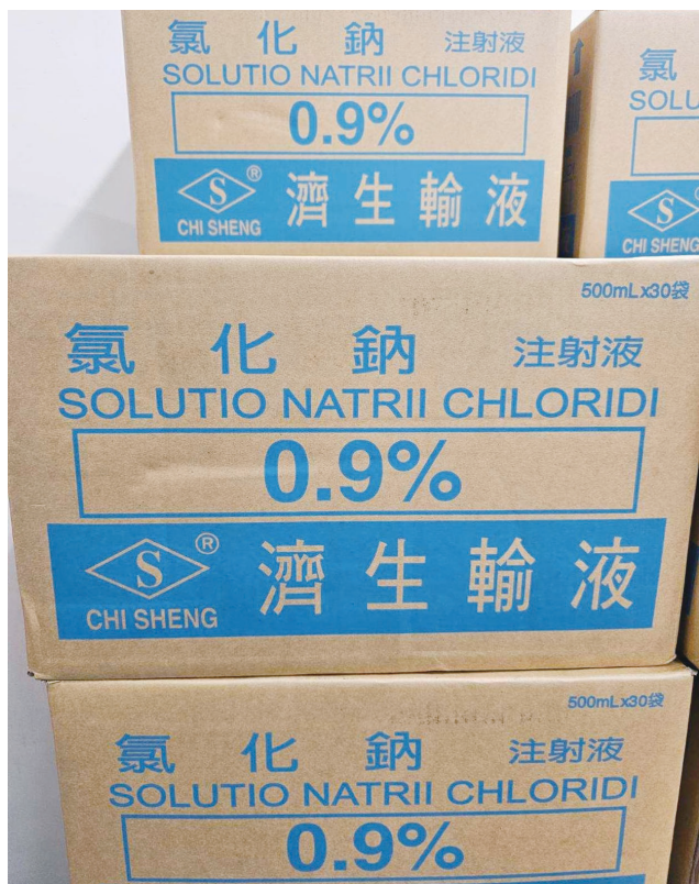
國內輸液大廠因違反規定勒令關廠造成缺貨，引起病友鄉親及衛生單位的關心；縣醫表示供貨穩定且維持3個月以上安全儲量，請病友放心。(圖/文：曹重偉)