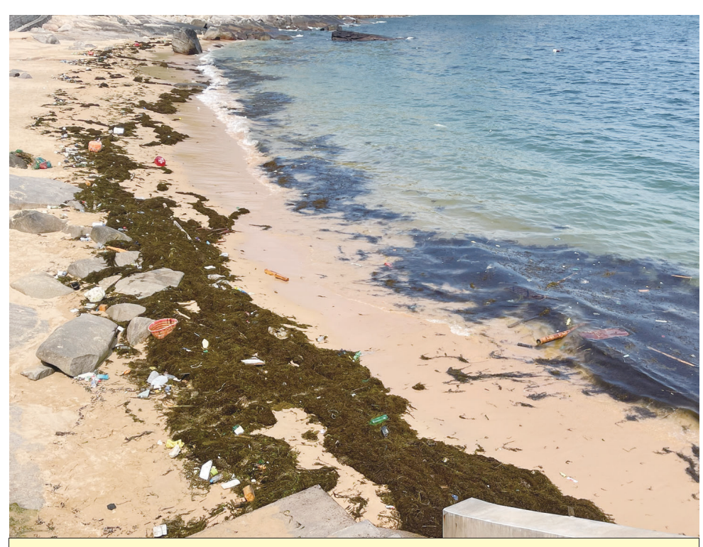
芹壁與橋仔等澳口近日罕見聚集大量銅藻，成為沙灘環保的一大難題。

【本報訊】芹壁沙灘近日出現今年以來數量最為龐大的銅藻，沙灘清潔人員表示往年芹壁不會有這麼多的銅藻，而且是一波接一波來，只能用人工力持續清除。 銅藻一般被認為與藍眼淚的出現有極大關連，今年的銅藻其實很早就出現，但數量都不是很多，且往年銅藻最常出現的塘后沙灘及午沙澳反而變的比較少。近日芹壁及橋仔等南面澳口竟出現大量銅藻，漁民說可能與近日持續吹著小東北風有關。 大量銅藻攔淺在沙灘上可是環保一大問題，銅藻若不加以清除，時間久了會產生腐爛現象，清潔人員現階段只能利用退潮時以人力持續清理，但這種現象也可能預告藍眼淚爆發期會在不久後出現。