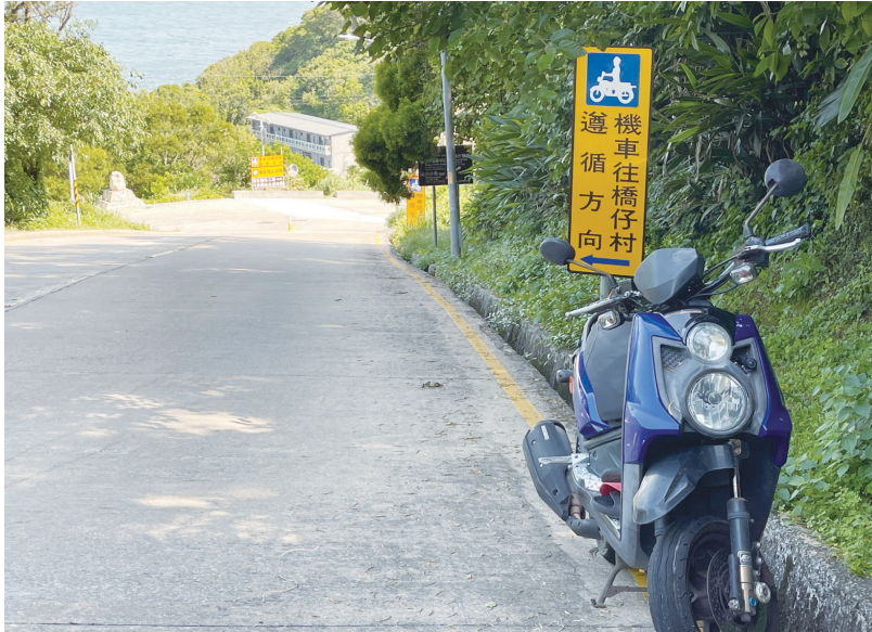
日前北竿一起重大機車車禍意外，經警方初步調查係爆胎所致，提醒用車人要注意車輛保養。(圖/文：陳鵬雄)