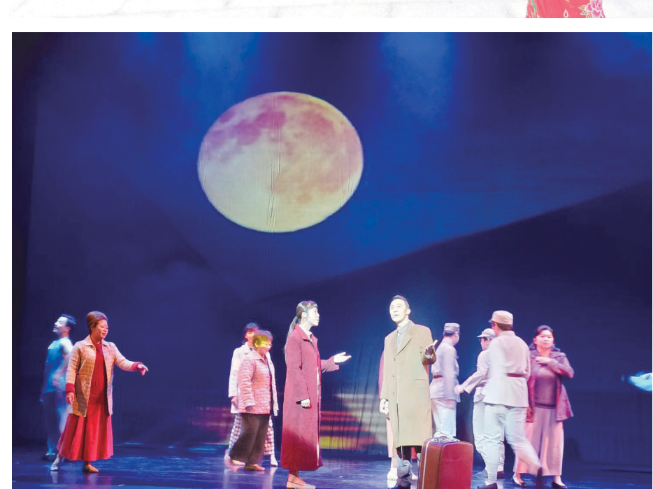
馬祖梅石藝文中心風光開幕，文化處邀請在地藝文團體會同台灣藝文界夥伴，演出《如果你路過梅石》、《馬祖四季水間》呈現在地特色。