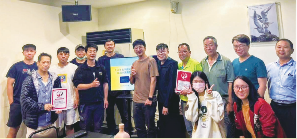
馬祖觀光圈產業聯盟5月6日晚間舉辦北竿地區共識會議，凝聚業者共識，並收集觀光發展建議。

國內新冠疫情仍有傳播風險 衛生局：施打疫苗有效預防，儘速接種 【記者曹重偉報導】連江縣衛生局表示，國內新冠肺炎疫情仍有傳播風險，施打疫苗能有效預防重症及死亡，本週適逢母親節，呼籲踴躍接種新冠疫苗，一同守護家人朋友的健康。 衛生局說明，依據疾病管制署統計，目前本土通報確診併發症及死亡病例中未曾接種新冠疫苗者佔95%以上，故呼籲未施打第1劑者，儘速接種；而與前1劑疫苗間隔已達12週(84天)之65歲以上長者，儘速再接種第2劑，讓免疫防護不中斷，降低重症或死亡發生風險。 衛生局提醒，接種疫苗是預防疾病最有效的方法之一，儘速完成疫苗接種，可及時獲得免疫保護減少疾病的威脅。有關各鄉疫苗接種時間或相關問題，可於上班時間電洽衛生局疫苗科0836-22095分機8885，王小姐。