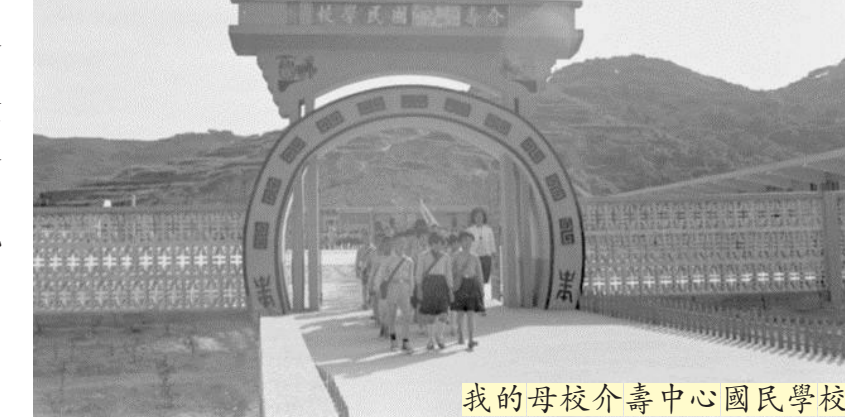
我的母校介壽中心國民學校