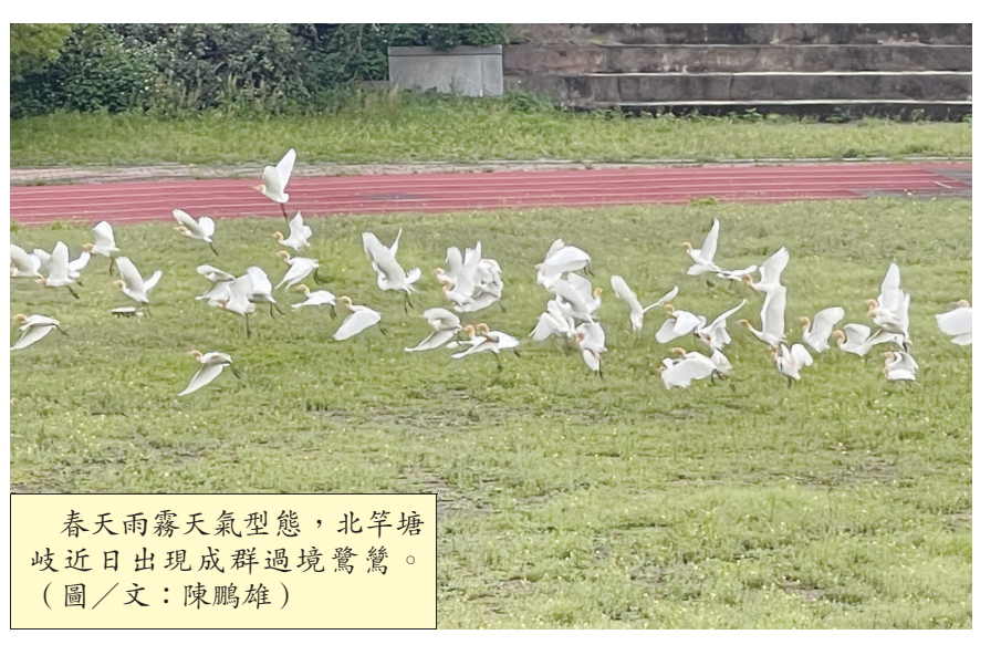
春天雨霧天氣型態，北竿塘岐近日出現成群過境鷺鷺。

【本報訊】又到了候鳥過境的季節，北竿塘岐地區近日出現大批牛背鷺鷺，讓機場巡場人員繃緊神經，每班機起降前都要大規模巡場驅鳥，以確保飛航安全。 每年4至5月會有大批鷺鷺過境馬祖，其中北竿地區多出現在塘岐平地以及坂里水庫附近，數量約百餘隻，停留時間大約兩個星期。近日塘岐已經出現鷺鷺，在運動場與機場之間徘徊停留覓食，而鷺鷺出現時多半會出現雨霧天氣型態，也是藍眼淚好發時段，但鷺鷺過境對機場而言也是存在威脅的，去年6月北竿機場曾發生一起班機受鳥擊事件，當時一架降落的班機在滑行道遭鳥擊，造成這架班機被迫留在馬祖過夜檢修。