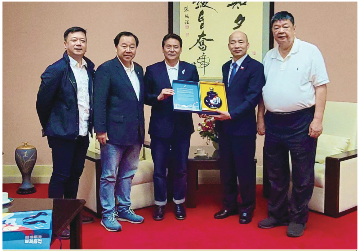
府會首長及立委陳雪生19日共同拜會立法院長韓國瑜，爭取立院支持北竿機場擴建、馬高航線復航，以及福馬小三通開放等政策。

韓國瑜支持金酒、馬酒成為立院紀念酒 王忠銘：品質一流 成立專案執行 【本報訊】立法院紀念酒一直是立院送禮或宴客使用，由於數量有限、外觀精緻相當搶手。府會首長與立委陳雪生19日拜訪中，立法院長韓國瑜特別強調會支持金馬在地經濟。 韓國瑜曾在莒光當兵所以對馬祖有著特別的情感，對馬祖的人事時地物都記憶猶新，也有很多馬祖的老朋友。他表示，金門、馬祖都是前線，長期守護台海第一線的安全，所以支持金門、馬祖的酒就是支持在地的經濟，這是非常重要的。 韓國瑜對東湧陳年高粱酒更是印象深刻，讚不絕口，特別問了東引酒廠目前生產的商品。王忠銘補充說，馬祖東湧陳年高粱酒獲得舊金山世界烈酒大賽連續三年雙金牌，是台灣唯一一支獲得特殊榮耀獎項的金牌獎酒，毫無疑問是台灣之光。 韓國瑜表示，有任何機會都會努力的幫馬祖高粱酒大力的推廣。王忠銘當即指示馬祖酒廠總經理劉九銘，立院紀念酒對馬酒推廣的重要性，在灌裝必須要更注重量質，屆時要成立專案來執行。