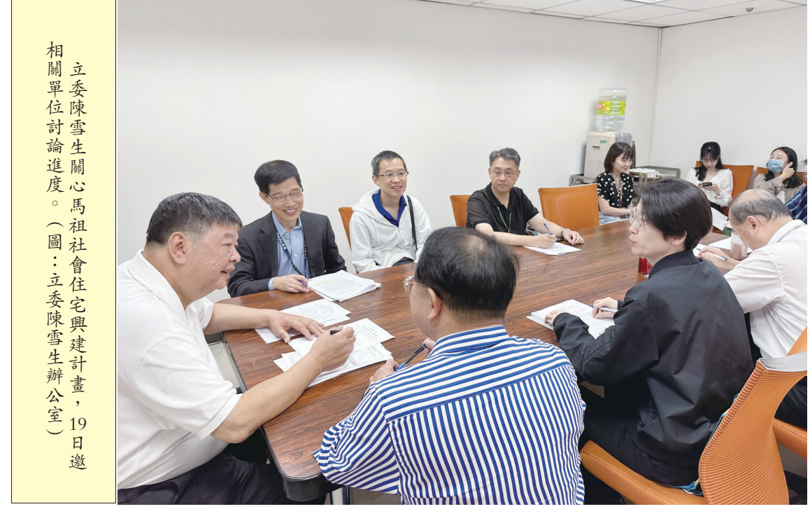
立委陳雪生關心馬祖社會住宅興建計畫，19日邀相關單位討論進度。

【記者馮紹夫報導】為爭取北竿機場擴建、馬高航線復航，以及福馬小三通開放等政策，縣長王忠銘、立委陳雪生與議長張水江19日共同拜會立法院長韓國瑜，盼立法院能共同支持三項重大議題，為馬祖帶來更多建設發展與便利。 立法院長韓國瑜過去曾在西莒當兵與馬祖結緣，韓國瑜當選立法院長後，府會首長首次在立委陳雪生陪同下拜訪院長，除了敘舊，縣長王忠銘也向韓國瑜提出爭取北竿機場擴建、馬高航線復航，以及福馬小三通開放等政策，盼立法院共同支持。 王忠銘表示，北竿機場過去曾發生2次空難，且易受天候濃霧因素影響及地形限制，無法有效正常飛航。經民航局辦理「南、北竿機場改善可行性評估」，擇定北竿機場擴建方案，降低無效飛航率，並為未來4C機場擴建預留可能性，工程總期約17年3月，總經費新臺幣3.2億、2000萬元，分為兩期執行。 其次，立榮航空曾於93年試辦馬祖高雄航線，當時因客運量不足而停航。然而自103年至113年間來馬旅客量由10萬人次逐年攀升至24萬人次，且地區南部軍民均有搭機需求；為了爭取搭機客運，交旅局特別拜會南部旅行團公會，均對航線表達支持，初步規劃辦理期間為9至11月執行，並為週三、週五、週日每日包機一、二次，後續將向交通部民航局爭取1,000萬元專案補助經費。 為爭取兩岸互動往來，落實「福馬一日生活圈」願景，現階段馬祖小三通航線已恢復至疫情前航班數。王忠銘持續爭取金馬小三通交流首先恢復，王忠銘表示，福馬貨運、經貿、文化等交流逐漸便利，提請政府開放台籍團客經由小三通赴陸旅遊，同時開放陸籍人士經由小三通來馬旅遊，以活絡在地經濟發展。